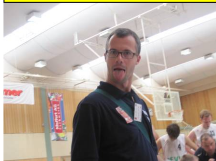
The „Missing Link“ ....