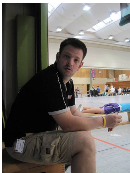
„Hä? Was? Wer? Wo bin ich?“

Leider wurde die Vorfreude auf ein abendliches kühles Glas Cola-Light (oder so) auf dem Volksfest bei strahlendem Sonnenschein und hohen Temperaturen dadurch getrübt, dass ein derzeit noch anonymes Anrufer eine Bombendrohung für den Volksfestplatz aussprach.